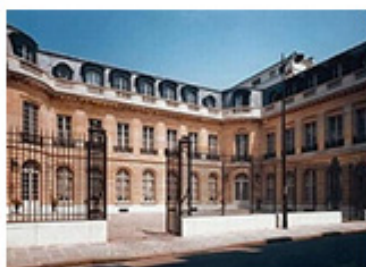
Maison de la chimie